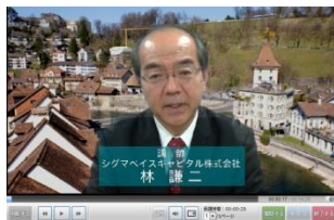
講師による重要ポイントの解説

■ 首都圏展開が限界だった従来の対面授業の枠を越え、全国はもちろん海外からの受講も可能に。