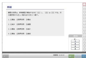
本試験と同じ形式で作成した模擬試験問題

プライベートバンカー資格試験のテスト形式はコンピュータ試験。本試験と同じ形式の模擬試験をPC上で提供できるのもeラーニングならではのメリット。