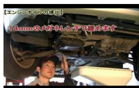
業務マニュアルコース 学習画面