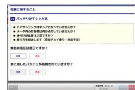
Q&Aによる故障診断が可能な トラブルシュート画面